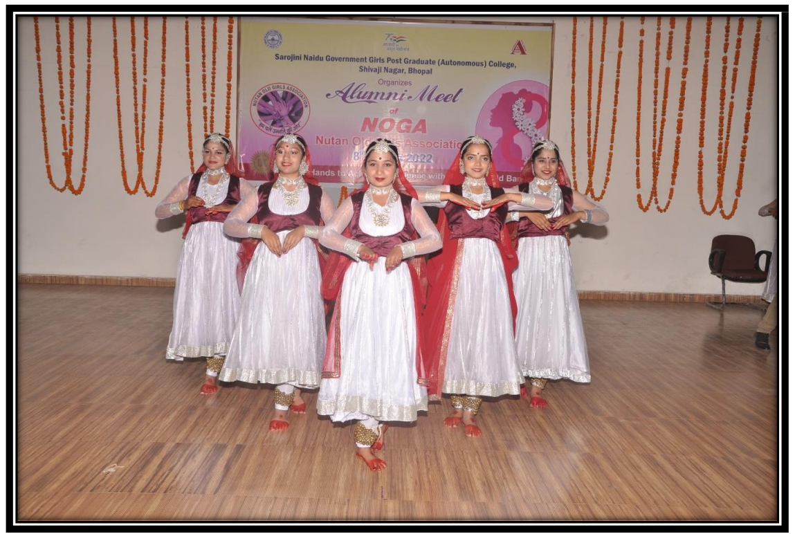
DANCE PERFORMANCE BY NOGA MEMBERS